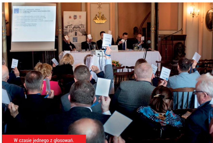
W czasie jednego z głosowań.

księgowością nie da się jednak zacara- rować rzeczywistości. A ta jest wyjąt- kowo niełaskawa zwłaszcza dla szpitali powiatowych. Na temat ich pogarsza- jącej się sytuacji finansowej była mowa podczas wielu kuluarowych dyskusji.