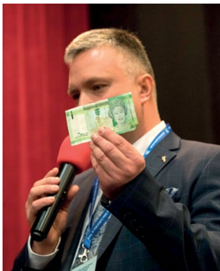
Jednofuntowy banknot z wyspy Jersey. Na szczęście!