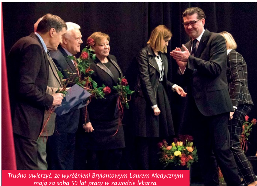
Trudno uwierzyć, że wyróżnieni Brylantowym Laurtem Medycznym mają za sobą 50 lat pracy w zawodzie lekarza.